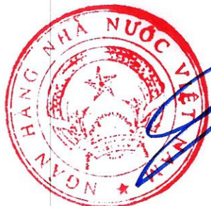
Nguyễn Văn Bình

THÔNG ĐỐC NGÂN HÀNG NHÀ NƯỚC TỔNG THANH TRA CHÍNH PHỦ